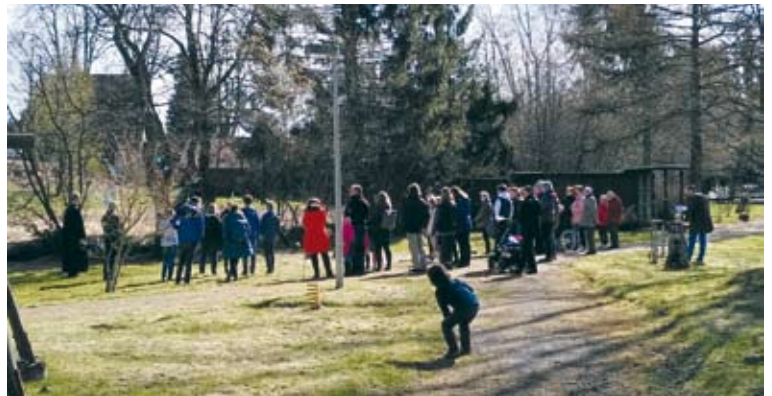
Auf dem Weg zu Christi Grab.

Und wer weiß: Vielleicht dauert es auch nicht mehr lange, bis endlich