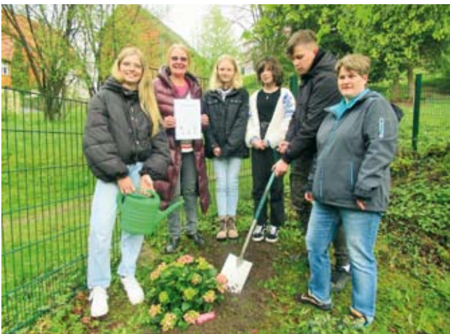
Eine Gartenhortensie wurde gepflanzt

mation in der Kirchengemeinde Bad Grund war von der Sparkasse Osterode den Konfirmand*Innen über viele Jahre ein Rosenstock, später ein Rhododendron gespendet worden. Bei der Pflanzaktion wurde den Jugendlichen eine Urkunde überreicht mit der Verpflichtung, die Pflanze auch zu pflegen. Nach Schließung der Zweigstelle in Bad Grund hat die Sparkasse Osterode weiterhin das Spenden einer Pflanze anlässlich der Konfirmation übernommen. Zusammen mit dem Kir-