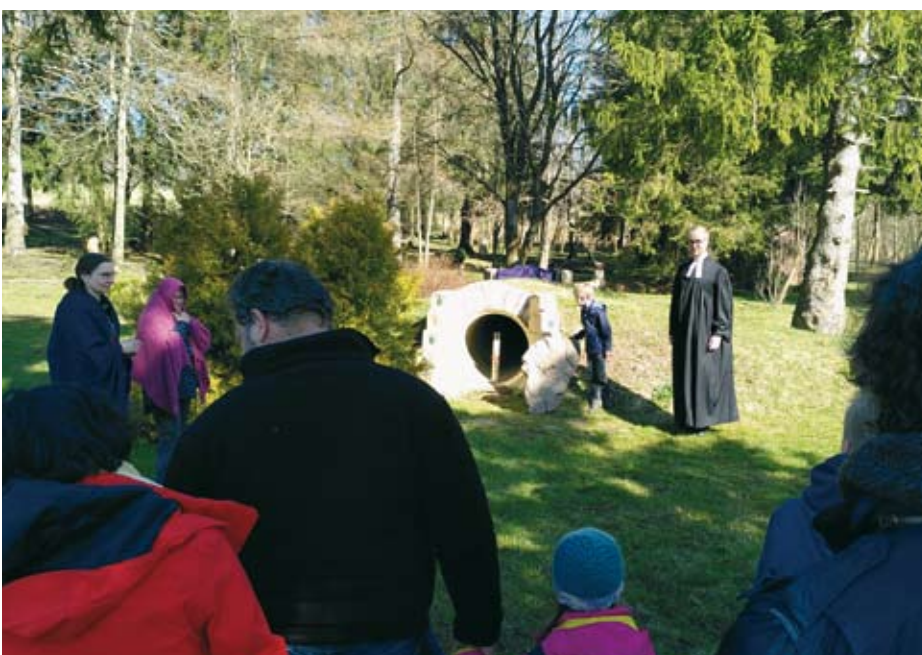
Familien-Gottesdienst am Ostermontag

Jeden zweiten und vierten Sonntag findet in Buntenbock ein Gottesdienst statt. Der Beginn ist zukünftig um 10.00 Uhr!