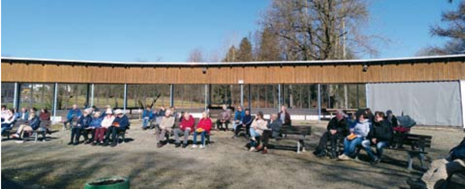
Familiengottesdienst im Freien.